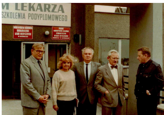
Katowice, lata 80.