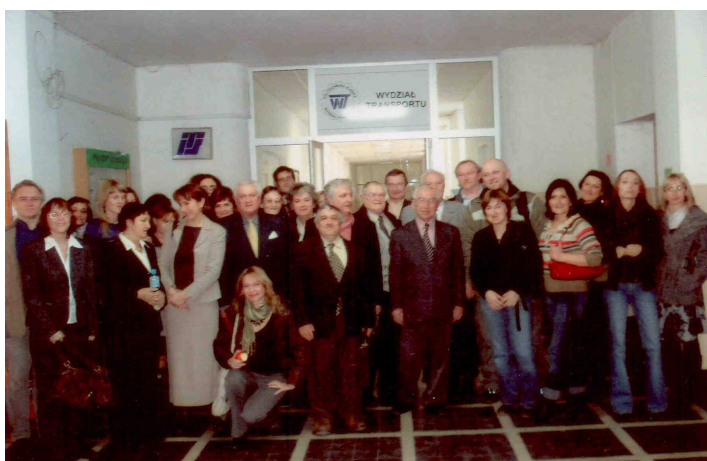
Katowice, marzec 2008 r.