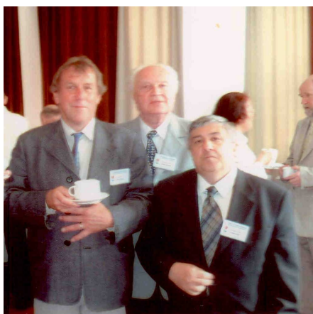
Warszawa 2008 r.